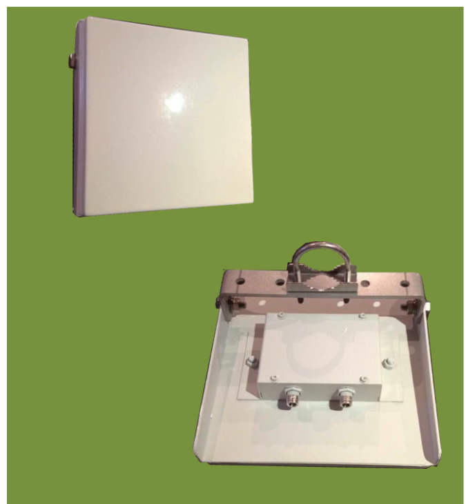
Antenne 1 Patch dual circulaire 873 MHz 8 dBi