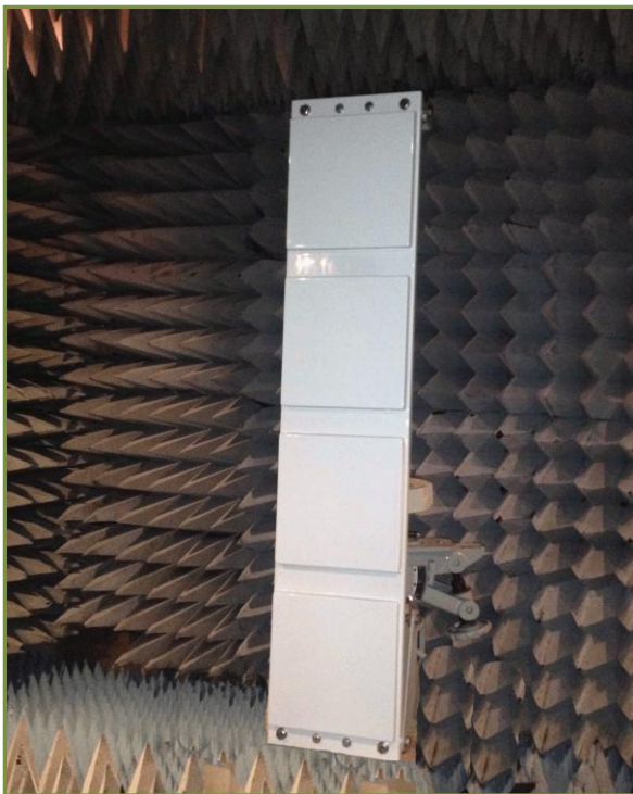
Antenne 4 Patches dual circulaire 873 MHz 14 dBi